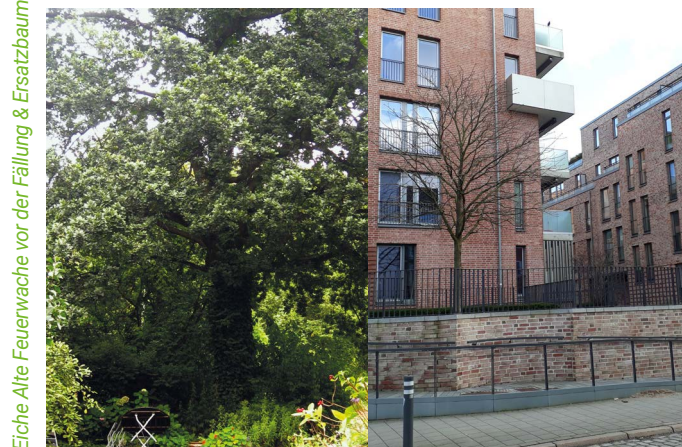
Eiche Alte Feuerwache vor der Fällung & Ersatzbaum '23.

Wir freuen uns auf Eure und Ihre Kommentare, Anmerkungen, Beiträge und Anwesenheit. Eine Stadt lebt vom Mitmachen. Lasst uns die Chance ergreifen und zu einem lebenswerten Kiel der Zukunft beitragen!