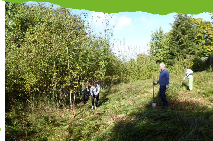
Pflegeinsatz im Ellerbeker Moor.

So, 24.09. ab 15 Uhr: Infospaziergang „Das Hinterland der Universität“. Treffpunkt Haltestelle Botanischer Garten (KVG Linie 81) Dauer ca. 2 Stunden. Auf einem Spaziergang wollen wir erkunden, wie die Pläne für die Unerweiterung aussehen und was dafür weichen muss.