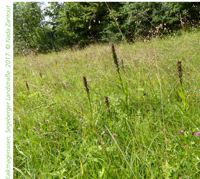
Kalkmagerrasen, Segeberger Landstraße 2017.

Wir betreuen drei geschützte Flächen im Kieler Stadtgebiet. Nach der Winterpause suchen wir nach Amphibien und Laich in den Gewässern, im Frühjahr halten wir nach Vögeln Ausschau und im Sommer erfassen wir wiederholt die vorkommenden Pflanzenarten. Gemeinsam wird bestimmt und jede(r) steuert die eigene Artenkenntnis bei. Wir freuen uns über Hilfe z.B. bei der aktiven Bekämpfung (zurückschneiden, rausreißen) von Neophyten oder anderen unerwünschten Pflanzenarten. Wer mitmachen möchte, kann sich gerne per E-Mail oder auf dem AB der Kreisgruppe melden. Termine stehen unter www.bund-kiel.de/service/termine und werden per E-Mail kommuniziert ( schutzgebiete.kiel@bund-sh.de ).