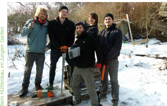
Beim Hüttenbau im Jungen Garten

Informationen zu den aktuellen Treffen sowie zu weiteren Veranstaltungen und Workshops im Jungen Garten gibt es auf: www.bundjugend-sh.de . Noch Fragen? Dann schreibt uns an kontakt@bundjugend-sh.de .