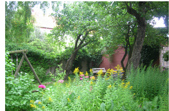
Wir brauchen grüne Oasen in der Innenstadt – diese fiel der maximal großen Blockinnenbebauung Nettelbeck-/Hardenbergstraße zum Opfer.